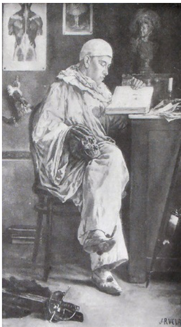
Figura 1. El Pierrot doctor de Ruelas tal y como apareció reproducido en la portada de El Mundo , el domingo 29 de enero de 1899. Fot. de Luis C. Sandoval. Esta imagen fue compilada por la Dra. Martha Eugenia Alfaro Cuevas (Centro Nacional de Investigación, Documentación e Información de Artes Plásticas) y se reproduce con autorización.