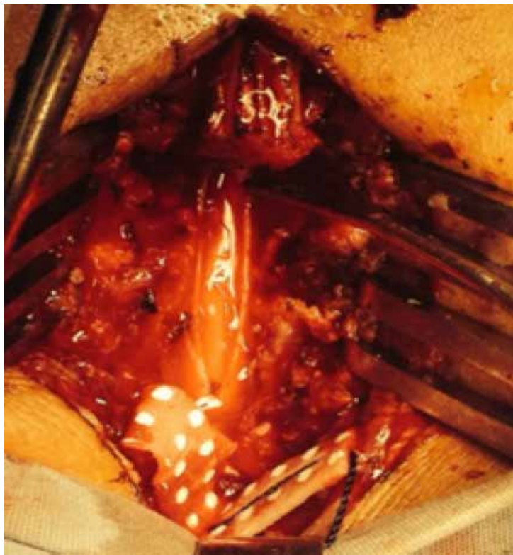
Imagen 3. Transoperatoria donde se observa cordones posteriores espinales posterior a extracción del hematoma y sin evidencia de malformaciones vasculares ni sangrado activo.