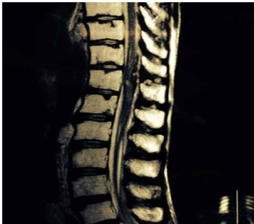
Imagen 1. RM en corte sagital secuencia T2 donde se observa imagen ocupativa intrarraquídea, intradural a nivel de T11-T12, en forma de huso y heterogénea que comprime en forma importante el cordón médula en dirección dorsoventral.